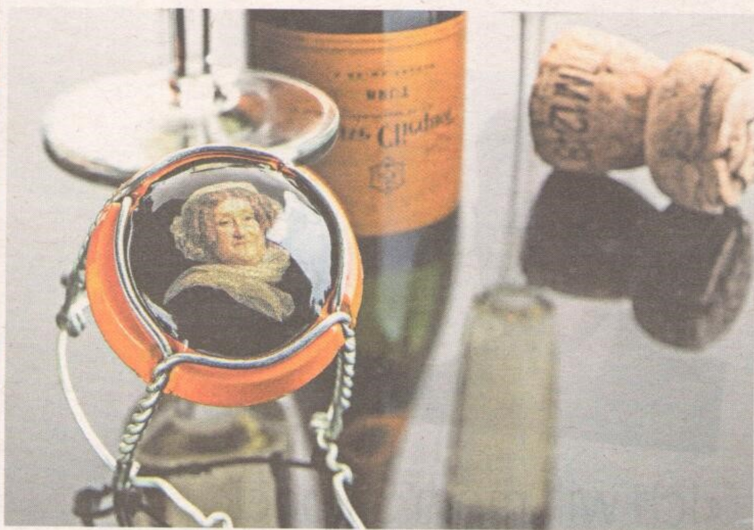
Das Porträt von Barbe-Nicole Clicquot-Ponsardin schmückt jeden Champagnerdeckel.

ganz entfernt. Dieses Verfahren hat Barbe-Nicole Clicquot-Ponsardin entwickelt: Sie interessierte sich für die Produktion und verbrachte viel Zeit im hauseigenen Keller. Dieser ist 24 Kilometer lang und aus Kalkgestein. Eine weitere Innovation von ihr ist der Rosé-Champagner: Hierfür fügte sie 1818 ihrem Yellow-Label-Champagner etwas Rotwein hinzu. Und bescherte ihrer Firma den ersten seiner Art.